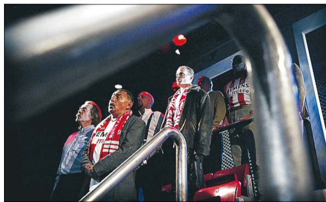
JOMFRU ANE satte "Tribunehelte" op i 2004 i samarbejde med Teatret Møllen i Haderslev.

Han er godt klar over, at hans nye arbejdsplads i Aalborg er en del større, men han glæder sig meget til ud-